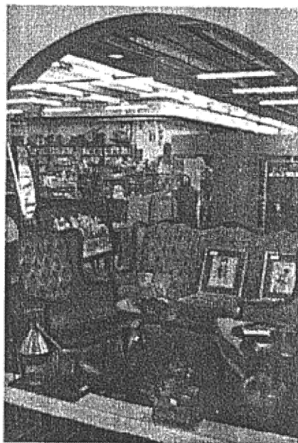
Nelle foto: il mercatino dell'usato al Città Fiera.

L'usato piace, dunque. E conviene. A chi acquista, certo, «ma anche a chi vende - aggiunge Bertossi -. Chiunque, infatti, può portare og-